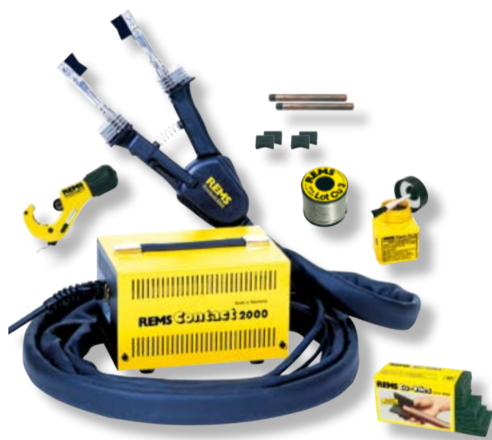
REMS Contact 2000 Super-Pack

Nejmenší, nejsilnější a nejrychlejší přístroj tohoto druhu!