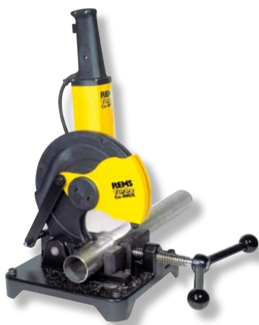
REMS Turbo Cu-INOX

Reže prakticky bez otřepů, pravouhle, rychle!