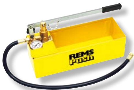
REMS Push – Ruční tlaková pumpa do 60 bar