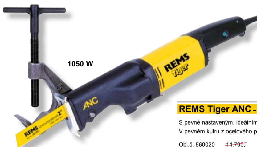
REMS Tiger ANC – Pila pro instalátora!

S pevně nastaveným, ideálním počtem zdvihů. 1050 W. V pevném kufru z ocelového plechu.