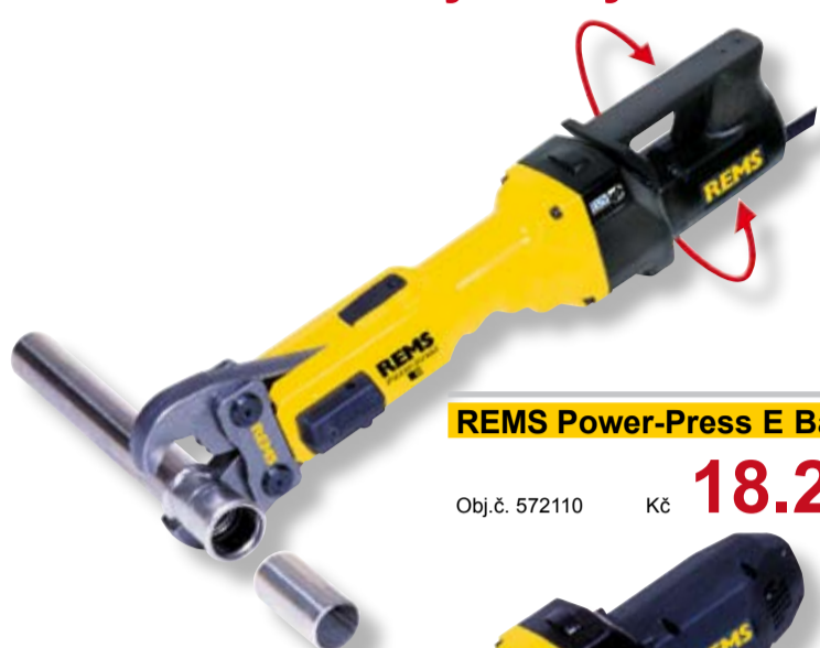
REMS Power-Press E Basic-Pack