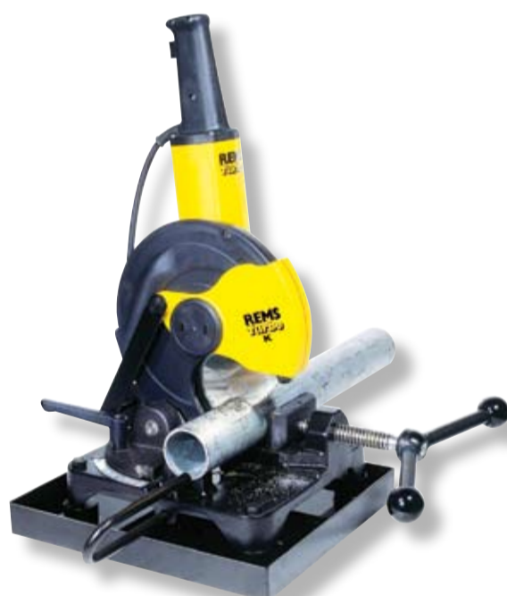
REMS Turbo K