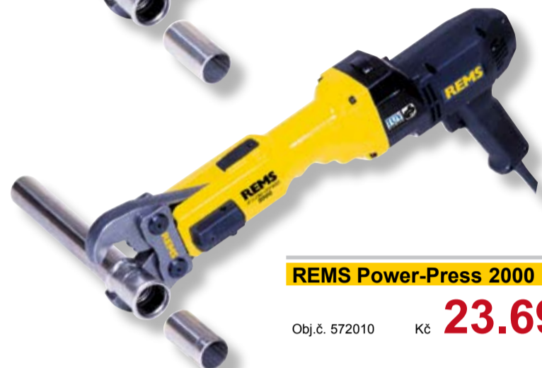
REMS Power-Press 2000 Basic-Pack