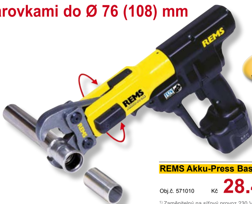
REMS Akku-Press Basic-Pack 1)