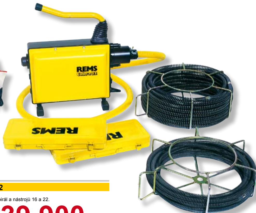
REMS Cobra 22 Set 16 + 22

Pohonná jednotka s vodící hadicí a sadou spirál a nástrojů 16 a 22.