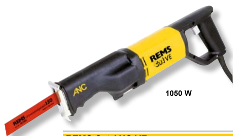
REMS Cat ANC VE – Reže kdekolí cokoli!