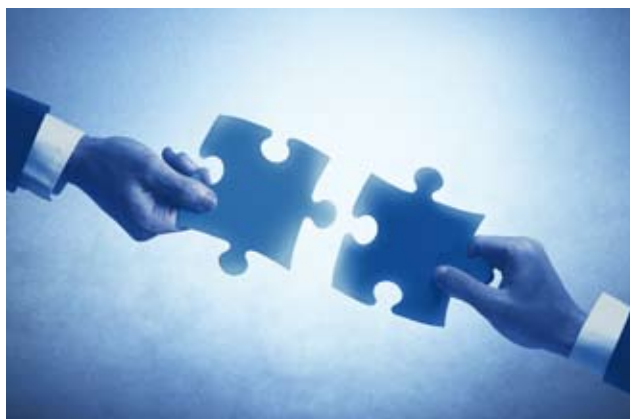
Zdroj: Archiv Rödl &amp; Partner