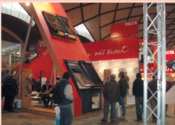
Nejpoutavější expozice 11. ročníku – stánek firmy Velux, anketa návštěvníků o nejpoutavější expozici

Velkému zájmu se těšilo na konci každého veletržního dne losování o ceny, kdy návštěvníci měli možnost vyhrát hodnotné ceny, kdy tou hlavní byla denně střecha na rodinný dům zdarma. Seznam výherců najdete na www.strechy-praha.cz .