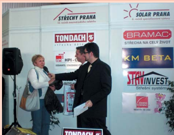
Losování o ceny