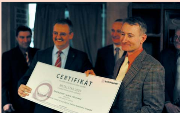
MetalStar pro firmu Josef Albl

– za stavbu Věž Letná na Letenském náměstí v Praze