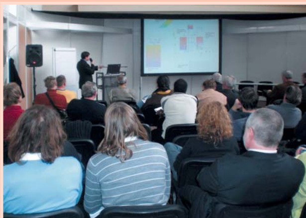
Přednášky a semináře

Seminář Solární a nulové domy se věnoval solárním aktivním domům, sezónní akumulaci sluneční energie pro energeticky úsporné domy, výstavbě sezónního akumulátoru s tepelným čerpadlem a uvedl konkrétní stavby solárních domů.