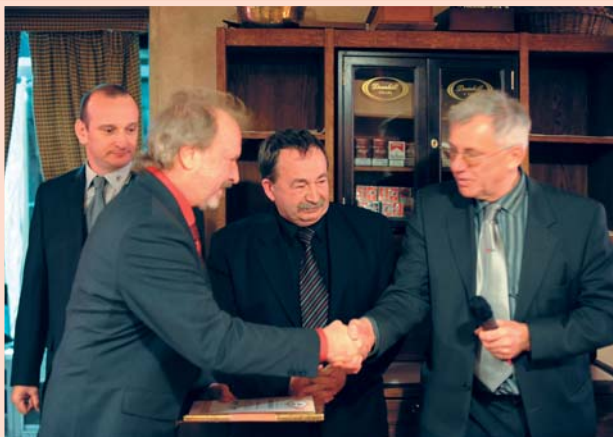
Zlatá taška pro firmu ROTO stavební elementy s.r.o.

V letošním ročníku soutěže Zlatá taška měla porota těžké rozhodování, neboť všechny přihlášené exponáty byly velmi zajímavé. Vítězem Zlaté tašky se stala firma ROTO stavební elementy s.r.o., která získala ocenění za plastové nízkoenergetické střešní okno ROTO DESIGNO.