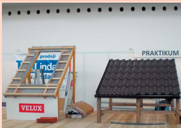
Praktikum – ukázky řemesla