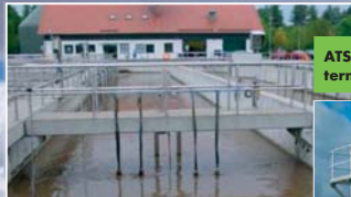
ATS - aerobní termofilní stabilizace