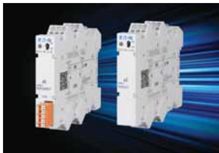
Elektronický jistič PXS24