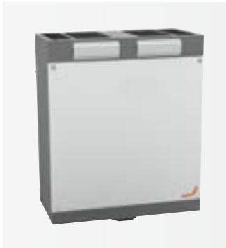
Zehnder ComfoAir 180

Kompaktní větrací jednotka se pohodlně vejde do standardní kuchyňské skříňky či do niky. Pro rozvody vzduchu není třeba snižovat podhledy v celém bytu. Tak zůstane bytová plocha a pocit volného prostoru zachován.