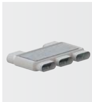
Rozvaděč flat 51, 4-násobný, s jedno- duchým napojením

Tam, kde nelze použít pevné díly, umožní ohebný prvek výšková uskočení a různé ohyby.