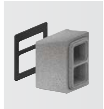
ComfoPipe Plus Připojovací box

V jednom stavebním dílu s průřezem 200 x 330 mm je veden venkovní i odvětrávaný vzduch. Potrubí zajišťuje jejich neprodyšné oddělení. Tepelně-izolační parametry potrubí splňují i požadavky náročné normy DIN 1946-6. Fixační spony slouží k upevnění stěnového zakrytí (např. sádkokartonu).