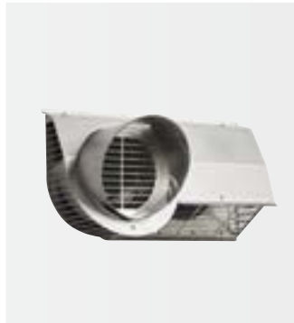
Kombinovaná mřížka na vnější stěnu

Kompaktní větrací jednotka se pohodlně vejde do standardní kuchyňské skříňky či do niky. Pro rozvody vzduchu není třeba snižovat podhledy v celém bytu. Tak zůstane bytová plocha a pocit volného prostoru zachován.