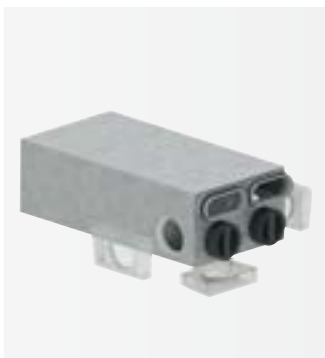
Kombinace akus- tického tlumiče/ rozdělovače

V různých provedeních, svislém nebo vodorovném, slouží k propojení mezi větrací jednotkou, akustickým tlumičem nebo dvojitým vzduchovým potrubím. Umožňuje napojení při minimálních prostorových nárocích.