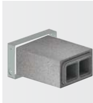
ComfoPipe Plus Dvojté potrubí & fixační spony

Venkovní a odvětrávaný vzduch je veden jen jedním instalačním prvkem, harmonicky včleněným do fasády. Díky promyšlené konstrukci je recirkulace odvětrávaného vzduchu zpět do objektu téměř vyloučena.