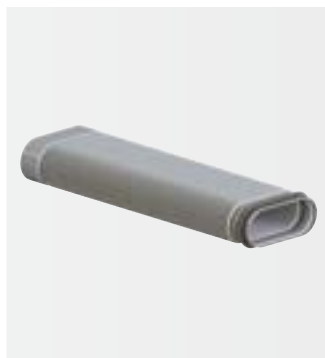
CK 300 Ohebný prvek

Akustický tlumič je opatřen speciálním tlumícím jádrem. Díky tomuto vysoce účinnému akustickému tlumení jsou eliminovány veškeré zvuky v potrubí přiváděného a odváděného vzduchu. Prvek navíc umožňuje přímé napojení vedlejších prostor a ventilů.