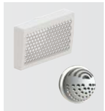
Renoventily pro přiváděný i odváděný vzduch

Namísto původních dvou je nyní rozdělovač napojen pouze jedním potrubím CK 300. Díky úspoře místa mohou být například i v chodbě šířky jen 110 cm osazeny pod stropem rozdělovače přiváděného i odváděného vzduchu vedle sebe.