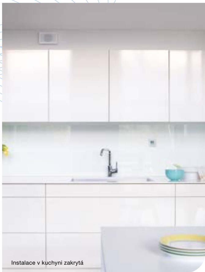
Instalace v kuchyni zakrytá