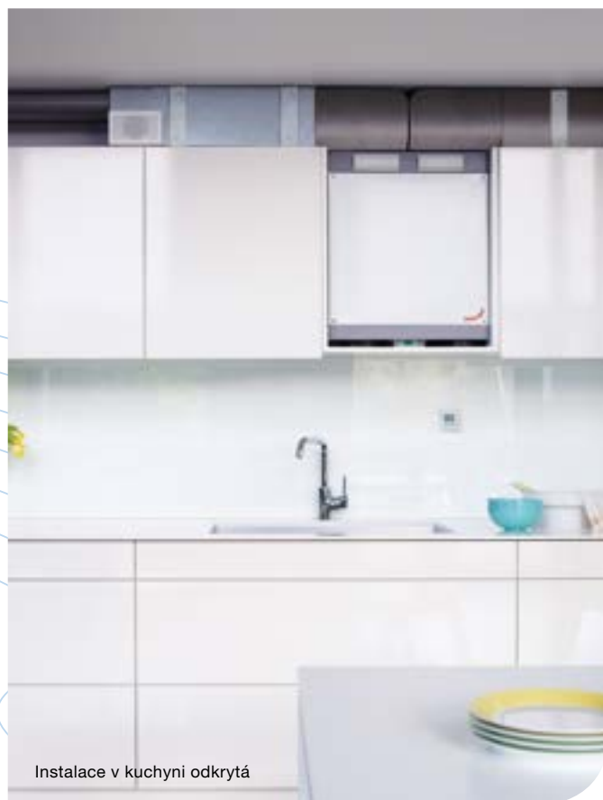
Instalace v kuchyni odkrytá