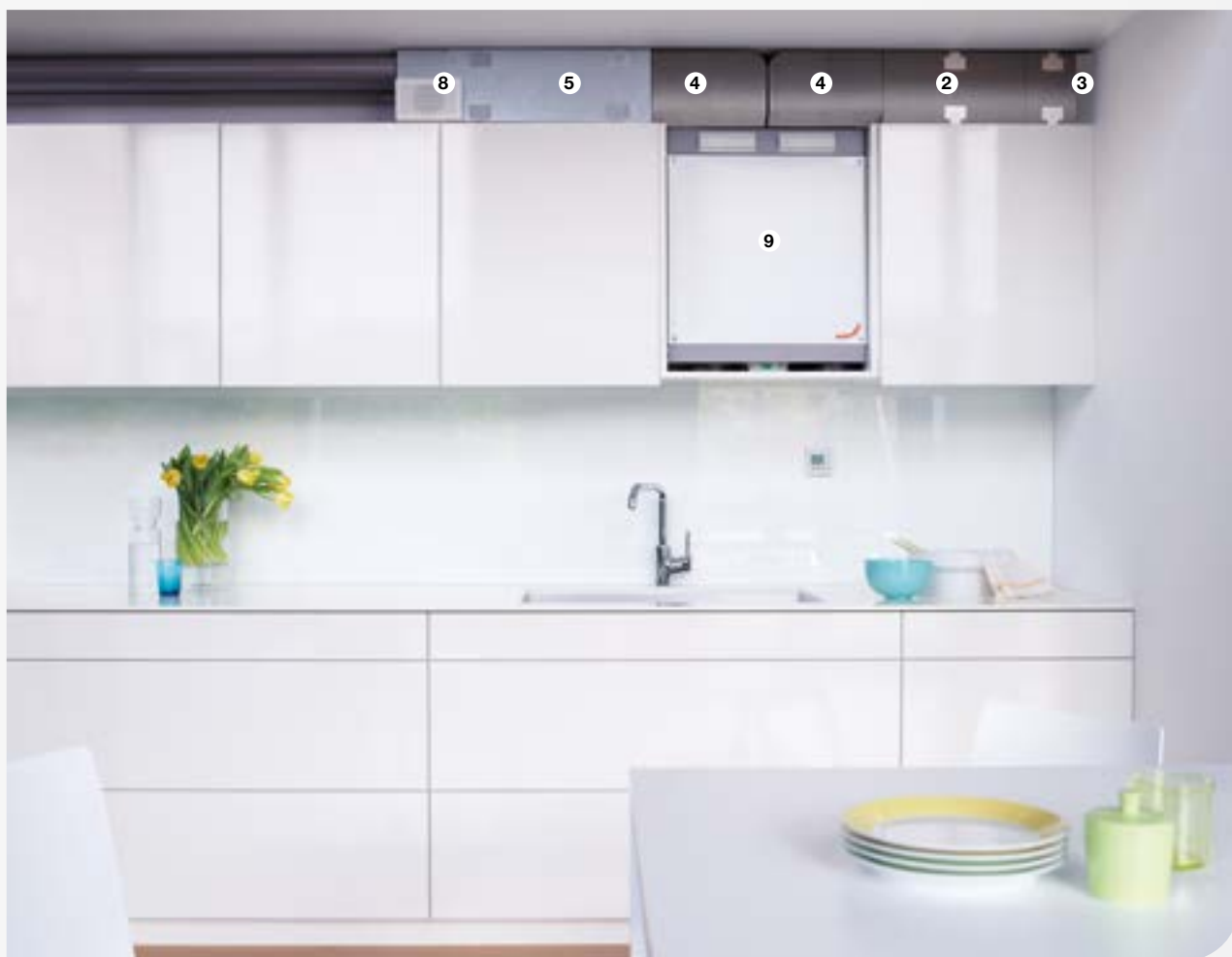
Instalace v kuchyni - odkrytá

Bezpečné: Chladný venkovní vzduch, vedený k větrací jednotce, nám díky perfektní tepelné izolaci potrubí neochladí interiér. Nehrozí ani kondenzace vlhkosti na potrubí.