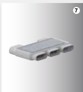
7 Rozvaděč flat 51, 4-násobný, s jedno- duchým napojením

Tam, kde nelze použít pevné díly, umožní ohebný prvek výšková uskočení a různé ohyby.