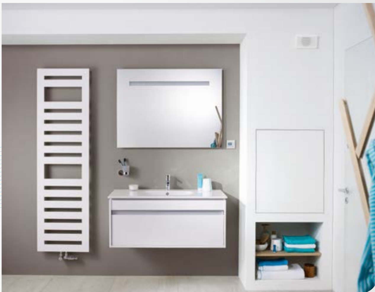
Instalace v koupelně - zakrytá

Vzhled: Vzhled bytu by neměl být ovlivněn technickými instalacemi. Všechny prvky větracího systému jsou proto instalovány skrytě uvnitř konstrukcí. Viditelné jsou jen vzduchové výustky a ovládací jednotka.