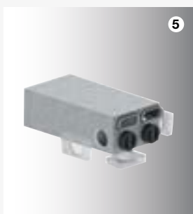
5 Kombinace akus- tického tlumiče/ rozdělovače

V různých provedeních, svislém nebo vodorovném, slouží k propojení mezi větrací jednotkou, akustickým tlumičem nebo dvojitým vzduchovým potrubím. Umožňuje napojení při minimálních prostorových nárocích.