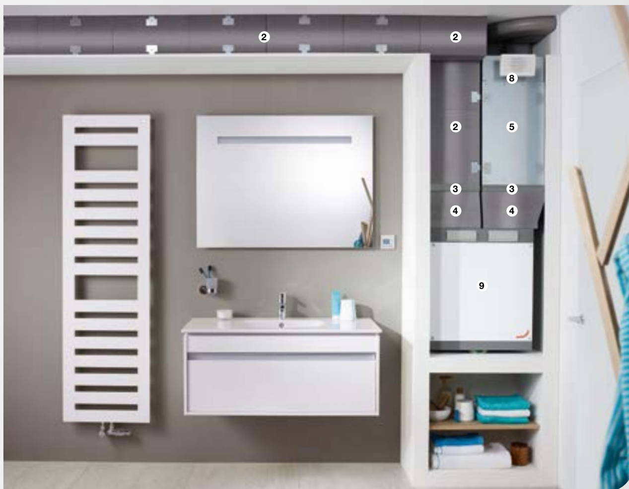
Instalace v koupelně - odkrytá

Snadno smontovatelný: Kompaktní systém rozvodů vzduchu se instaluje rychle a snadno - ať již v novostavbě či při rekonstrukcích. Při čištění a údržbě jsou všechny komponenty snadno přístupné.