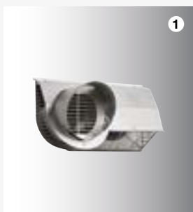
1 Kombinovaná mřížka na vnější stěnu

Venkovní a odvětrávaný vzduch je veden jen jedním instalačním prvkem, harmonicky včleněným do fasády. Díky promyšlené konstrukci je recirkulace odvětrávaného vzduchu zpět do objektu téměř vyloučena.