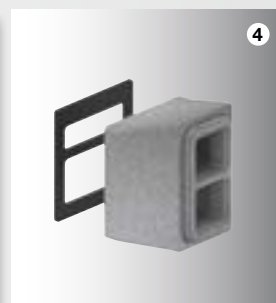
4 ComfoPipe Plus Připojovací box

Umožní instalaci dvojitého potrubí mezi dva pevné díly (např. větrací jednotku a vstup potrubí obvodovou zdí). To usnadňuje liniíovou montáž potrubí a umožní i korekce nerovností.