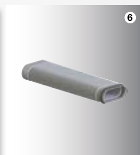
6 CK 300 Ohebný prvek

Akustický tlumič je opatřen speciálním tlumícím jádrem. Díky tomuto vysoce účinnému akustickému tlumení jsou eliminovány veškeré zvuky v potrubí přiváděného a odváděného vzduchu. Prvek navíc umožňuje přímé napojení vedlejších prostor a ventilů.