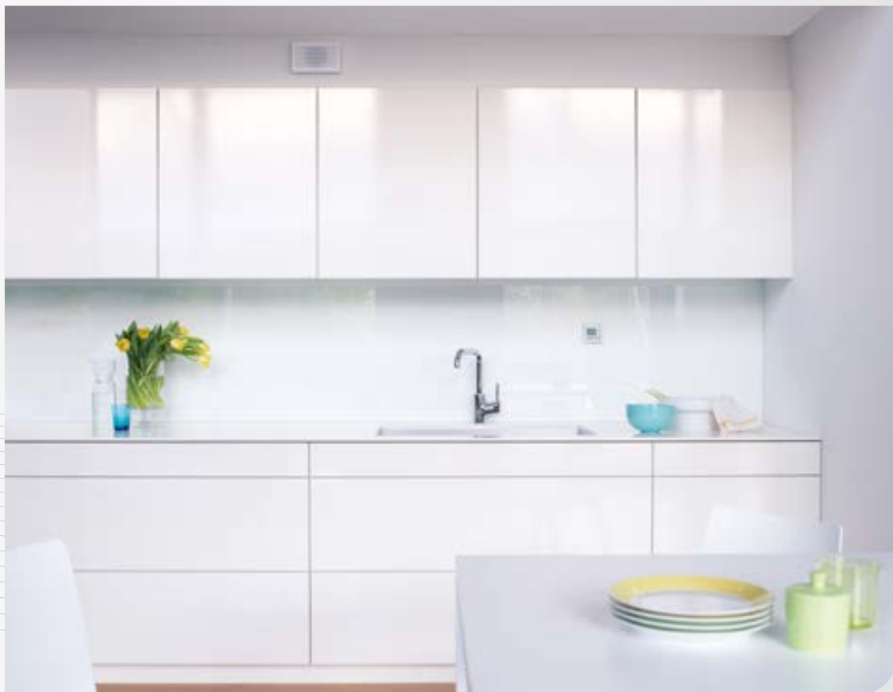
Instalace v kuchyni - zakrytá

Úspora energie: Více jak 70% z celkové energetické potřeby domácností je spotřebováno pro vytápění. Při větrání okny uniká drahocenné teplo ven - a to není dobré pro celkovou energetickou bilanci ani pro Vaši peněženku.