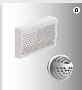
8 Renoventily pro přiváděný i od- váděný vzduch

Namísto původních dvou je nyní rozdělovač napojen pouze jedním potrubím CK 300. Díky úspoře místa mohou být například i v chodbě šířky jen 110 cm osazeny pod stropem rozdělovače přiváděného i odváděného vzduchu vedle sebe.