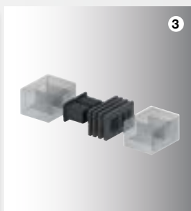
3 ComfoPipe Plus Délkový kompenzátor

V jednom stavebním dílu s průřezem 200 x 330 mm je veden venkovní i odvětrávaný vzduch. Potrubí zajišťuje jejich neprodyšné oddělení. Tepelně-izolační parametry potrubí splňují i požadavky náročné normy DIN 1946-6. Fixační spony slouží k upevnění stěnového zakrytí (např. sádkartonu).