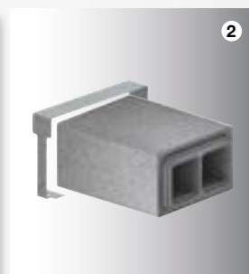
2 ComfoPipe Plus Dvojté potrubí & fixační spony

Venkovní a odvětrávaný vzduch je veden jen jedním instalačním prvkem, harmonicky včleněným do fasády. Díky promyšlené konstrukci je recirkulace odvětrávaného vzduchu zpět do objektu téměř vyloučena.