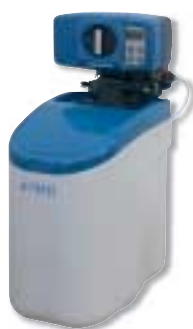
IVAR.DEIN-KAB 007 - 014

Zařízení určené pro úpravu vody změkčováním. Skládá se z řídicí hlavy (pro typ 005 - ruční, pro typy 007 a 014 elektronická), sklolaminátové tlakové láhve s katexovou pryskyřicí a nádoby na solankový roztok s plovákovým uzávěrem. Změkčovací filtr je nutno připojit na kanalizační odpad, aby se zachycené ionty vápníku a hořčíku daly vypustit. Tato typová řada je vhodná pro doplňování změkčené vody do teplvodních topných systémů. Pro regeneraci náplně se používá GEL.SŮL CS (čistá tableťovaná sůl), kód 410.600.44CS.