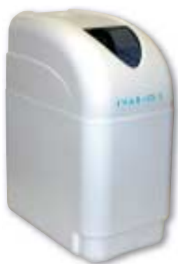
IVAR.DEVAP-KAB 010 - 030

Zařízení určené pro úpravu pitné vody změkčováním, v ceně je programovatelná plně elektronická programovací a řídicí jednotka typu WSCI (řízení podle času nebo objemu), mísicí by-pass, kompaktní nádrž na sůl, do které je integrována láhev s resinem a kryt. Tuto typovou řadu je možno použít i pro změkčování vody určené pro plnění topných systémů.